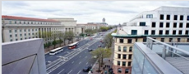
〈 Pennsylvania Avenue, Washington D.C〉