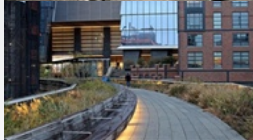
〈High Line Park, New York -전 과 후〉