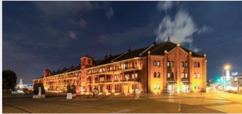
〈 Redbricks Warehouse, Yokohama 〉