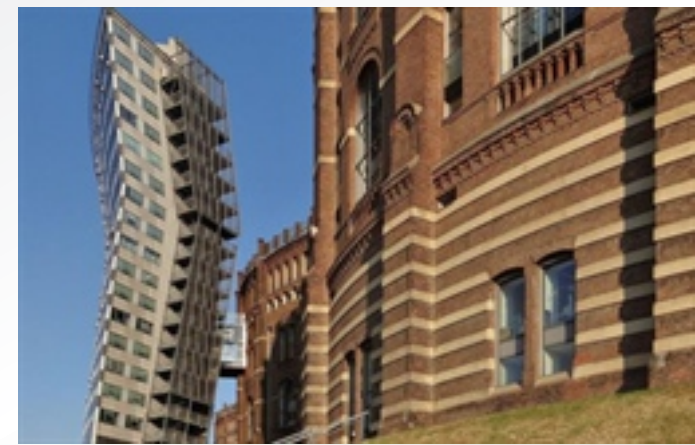
〈 Gasometa City, Vienna 〉