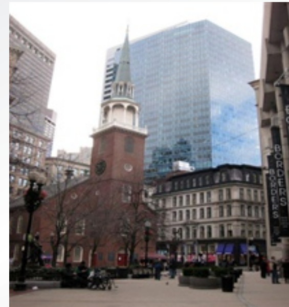
〈 Boston Historic Trail 〉