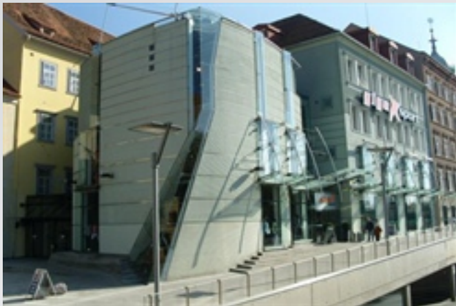
〈 Commercial Building, Graz, Austria 〉