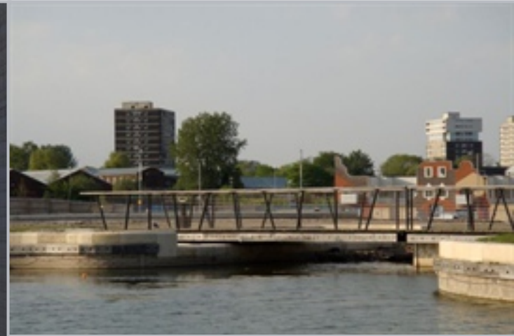
〈 뉴이슬링턴, 맨체스터 〉