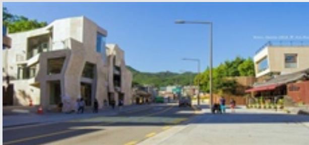
〈 삼청동 길〉