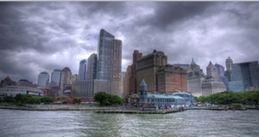
〈 Battery Park City development, New York 〉