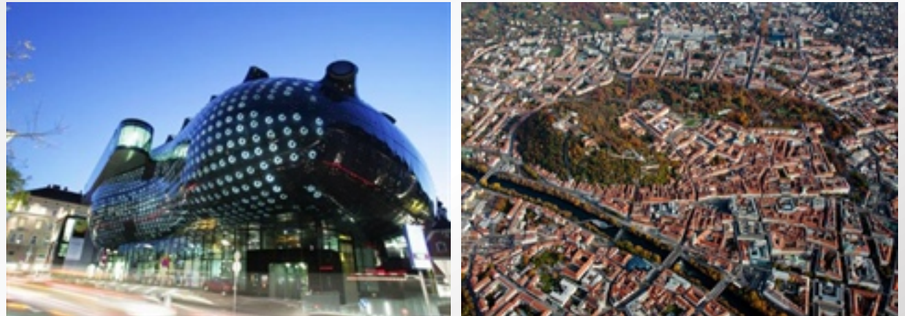
〈 Graz, Austria 〉