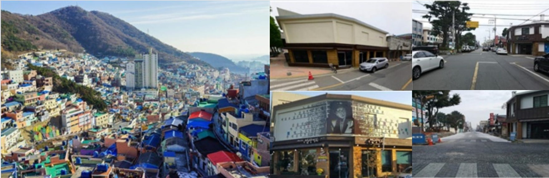
〈 부산 감천문화마을 〉