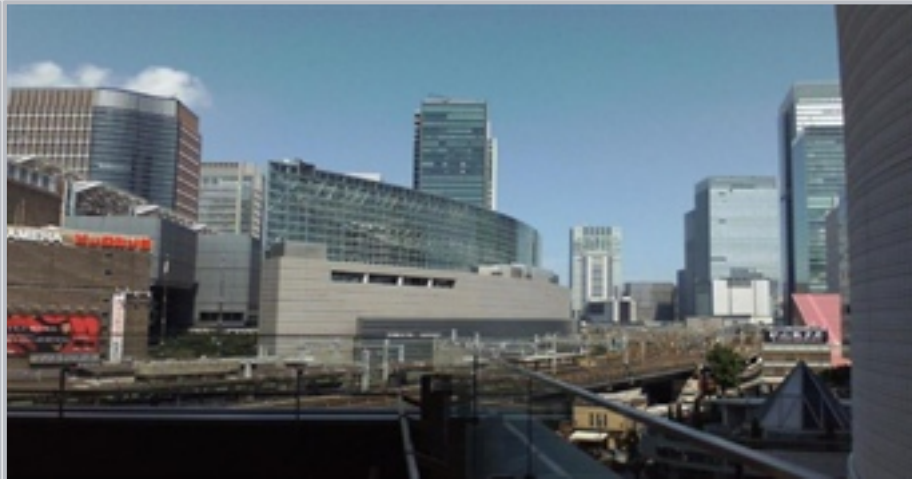
〈 아에스 입구 업무상업 육성형 종합개발, 東京都(동경도) 〉