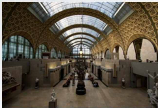
〈 Orsay Museum 〉