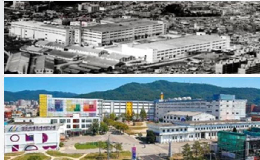
〈 청주시 연초제조창 〉