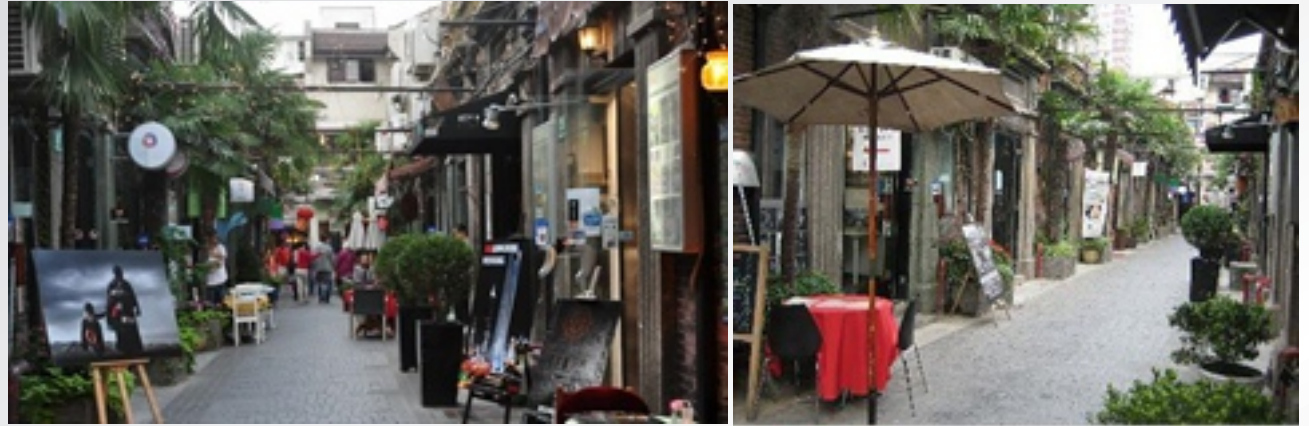
〈 상해 타이강루 〉